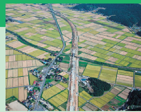
아스미~쓰루오카 구간 약 26km

일본해 연안 도호쿠 자동차도로는 니가타시에서 쓰루오카시, 사카타시, 아키타시 등을 거쳐 아오모리까지를 연결되는 노선입니다. 아마가타현 소나이 지역은 풍요로운 자연과 관광 자원을 가지고 있어, 영화 「굿바이」의 무대가 되기도 하였습니다. 고속도로가 개통되면, 지역간 교류가 활발해져 아마가타현의 특산물인 벚 「쓰야히메」를 비롯한 아마가타현 특산물의 판로 확대와 관광 진흥 등이 실현되어 지역 활성화가 기대됩니다. (2011년도 공용 예정)