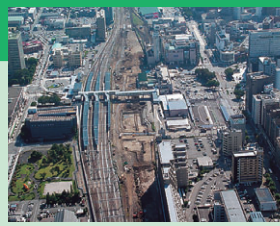
도야마 역 주변

호쿠리쿠 신칸센은, 연선 지역의 비약적인 발전을 도모하는데 커다란 효과를 가져옵니다. 또한, 도카이도 신칸센의 대체 보안 기능을 가지며, 동해(일본해) 국토축의 형성에 반드시 필요한 국가 프로젝트로서도 조속한 정비를 실시할 필요가 있습니다. 2014년도 말 개통을 목표로, 도야마현내의 모든 구간에서 공사가 착수되어 순조롭게 진행되고 있습니다.