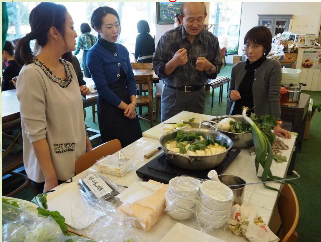
東京のオーガニックカフェ「ルル」