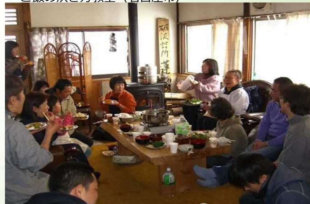
土徳料理を楽しむ会 (みのふあーむ)