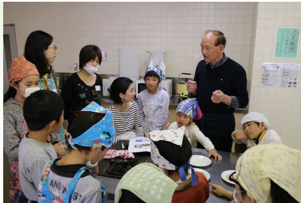
ご飯の炊き方教室 (名古屋市)