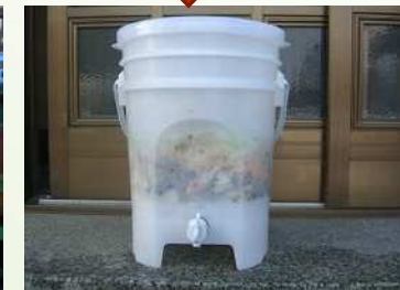
微生物培養タンク