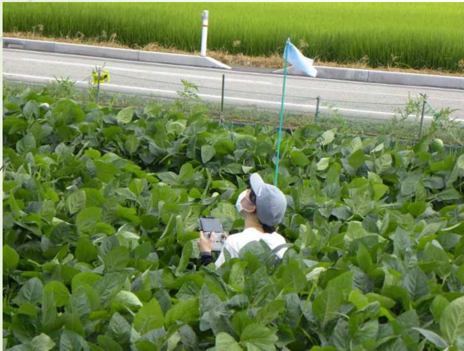
葉色調査（ドローン使用）

また新規に有機栽培に取り組む農家に対しては土質が全く異なることから別々のメニューを作って現在、栽培実験を進めている。今年度でかなりの知見が系統的に整理できるのでそれに基づいて有機大豆栽培の経済性をも明確にできている。