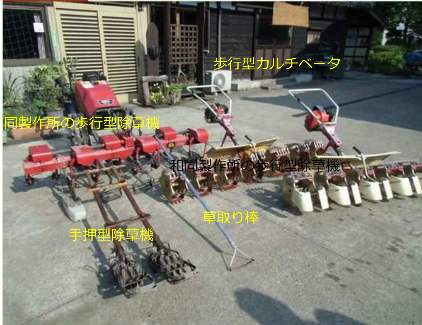
和同製作所の歩行型除草機（H15導入）