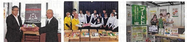
【スーパーでの常設のフードドライブの様子】 【食育推進全国大会でのPR】 フードドライブ回収ボックス】