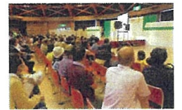
小島よしおさんトークショー