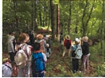
森と地下水の環境観察会

若い世代を対象に本県の豊かで清らかな水環境に理解を深め、保全活動への参加を促すため、令和5年7～8月に「とやま森・川・海の環境観察会」を開催(小学生とその保護者109名が参加)