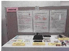
グループパネル展示

県消費者協会が育成し、地域で活動する「消費生活研究グループ」がエシカル消費を調査研究し、消費者大会等で発表。