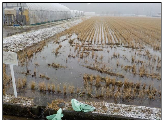
富山地域地下水利用対策協議会での涵養事業（立山町内）