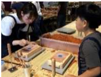
鋳物工房でのものづくり体験