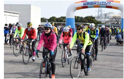
富山湾岸サイクリング