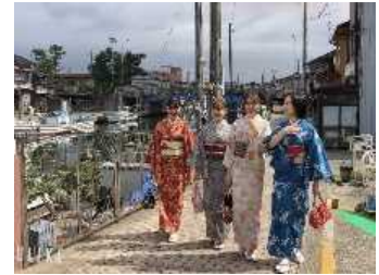
着物で内川(射水市)のまちを散策