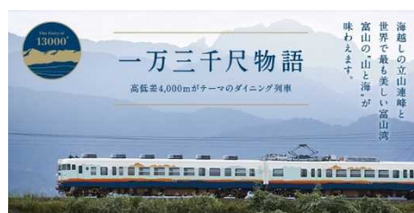
あいの風とやま鉄道「一万三千尺物語」