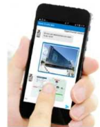
外国人向け AIチャットボット