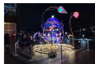
富岩運河環水公園（光のオブジェ）