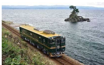
JR 氷見線・城端線の観光列車「べるもんた」