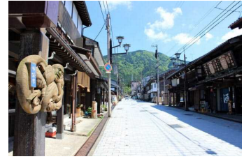
日本遺産「宮大工の鑿一丁から生まれた木彫刻美術館・井波」