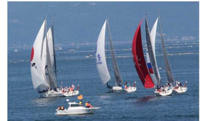
極東杯国際ヨットレース