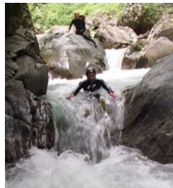
黒部川キャニオニング