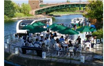
ユニークベニューの例 （富岩運河環水公園）

本県でコンベンションが開催される際に、主催者等の負担を軽減するきめ細かな支援を充実させるとともに、県内のユニークベニュー（※1）を会場とするレセプションや富山ならではの魅力を体感できるエクスカージョン（※2）を提案し、主催者や参加者の満足度向上を図る。