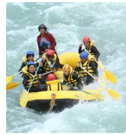
黒部川でのラフティング