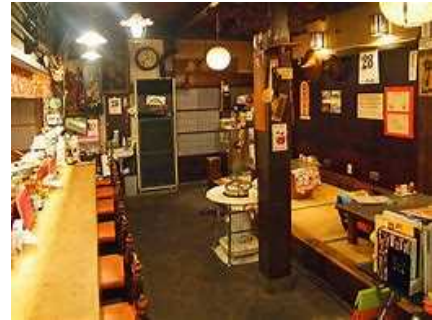
トリップアドバイザーで評価が高い「平安楽」（岐阜県高山市）