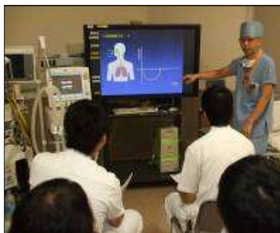
レジデントレクチャーの様子