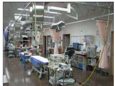
当院救急室の風景