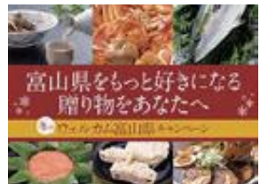
ウェルカム富山県キャンペーン