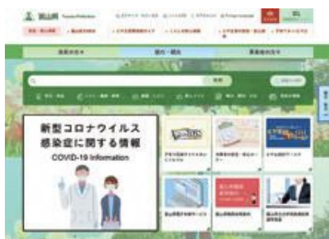
PC版 県民の方々向けトップページ