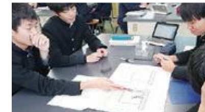
タブレットを活用した授業