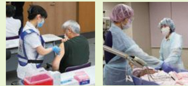
新型コロナウイルス感染症ワクチンの医療従事者優先接種