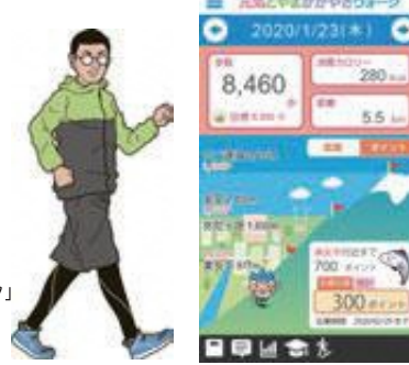
スマホアプリ「元気とやまがやきウォーク」