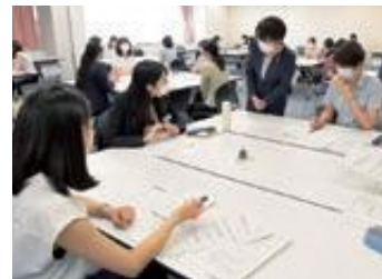
短めく女性リーダー塾