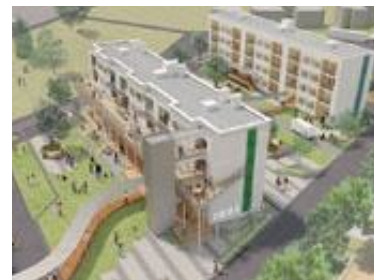
創業支援施設・UIターン住居イメージ