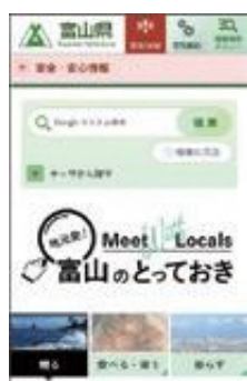
スマートフォン版 魅力・観光まとめページ