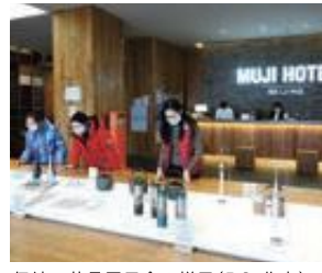
伝統工芸品展示会の様子(R3 北京)

SDGs(持続可能な開発目標):持続可能な世界を実現するための17のゴール・169のターゲットから構成され、地球上の誰一人として取り残さないことを誓う。2030年までの国際目標です。富山県は令和元年7月、国のSDGs未来都市に選定され、SDGsの達成に向け各種施策を展開し、持続可能な県づくりに取り組んでいます。