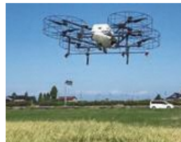
農業用ドローンによる農薬散布