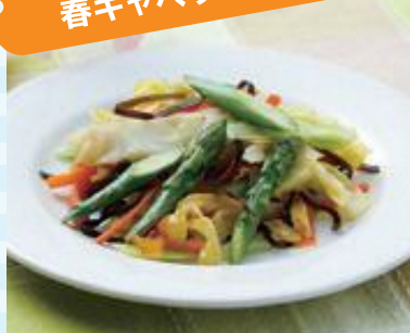
<協力> 砺波市食生活改善推進員協議会

アスパラガス …… 3本 塩昆布 …… 7g キャベツ …… 150g オリーブ油 …… 大さじ1 にんじん …… 30g