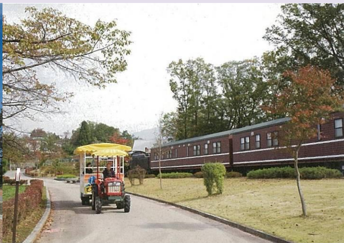
[光の賞] とちつかわ 栃津川を愛する会 (立山町)