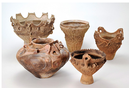
天神山式土器（縄文中期） （重要文化財：境A遺跡出土品）

このように、富山県は、縄文時代からまさに東西文化の交流点だったことがよくわかります。