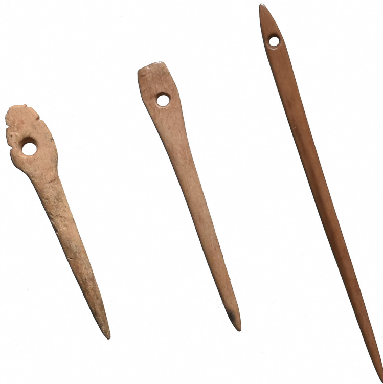
小竹貝塚出土品(富山市呉羽) 《針》

動物の骨角を利用して作られた針です。写真に掲載されている針は有孔のものですが、無孔のものも小竹貝塚から出土しています。一点一点どれを見ても、針先の鋭利さや孔の形など、細部に至るまで精工に加工されており、当時の技術の高さをうかがえます。