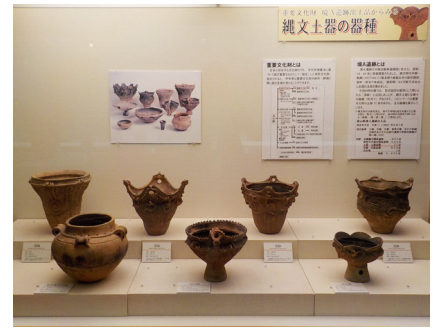
富山県境A遺跡出土品

考古学者が型式を決める際の基準となるのは、「深鉢」と呼ばれる背の高い土器です。そのほかにも、「浅鉢」「台付鉢」「有孔罎付土器」など様々な器種（形式）が存在し、共通する文様が見られる場合もあります。ここでは、朝日町境A遺跡から出土した重要文化財「富山県境A遺跡出土品」のうち、主な器種や一風変わった形の土器を展示しています。