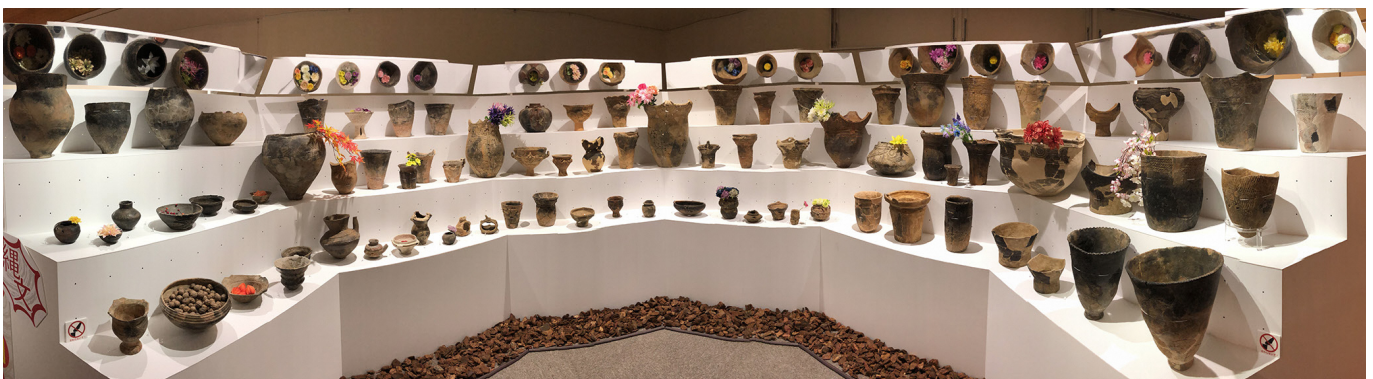
スマートフォンを利用した円形土器劇場のパノラマ写真