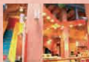
キンダールームとブレイトンネル