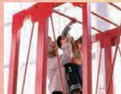
生命科学館の運動ゾーン